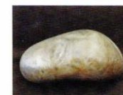
意心帰 [2016年] ホワイトブロンズ