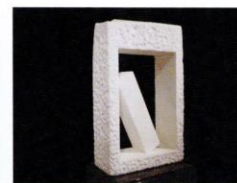
生棒 [2010年] スタトゥアーリオ白大理石