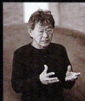
安田 侃 (やすだかん、彫刻家)

1945年 北海道美瑛市生まれ 1969年 東京藝術大学大学院彫刻科修士課程修了 1970年 イタリア政府招聘留学生として渡伊。以降、大理石の産地として知られるトスカナのピエトラサンタにアトリエを構え、大理石とブロンズによる彫刻の創作活動を始める