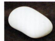
天秘 [2010年] スタトゥアーリオ白大理石