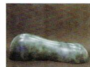
天翔 [2013年] ブロンズ