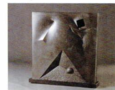
無何有 [1992年] ブロンズ