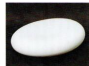
天秘 [2010年] スタトゥアーリオ白大理石