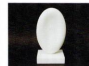
天秘 [2000年] スタトゥアーリオ白大理石