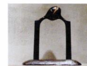
帰門 [1994年] ブロンズ