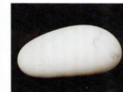
意心帰 [2001年] スタトゥアーリオ白大理石