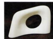
妙夢 [2000年] スタトゥアーリオ白大理石