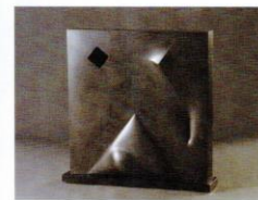
無何有 [1992年] ブロンズ