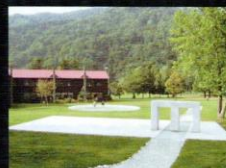
安田侃彫刻美術館 アルテピアッツァ美瑛 www.artepiazza.jp

この度、公益財団法人 萬田記念病院は、創成川公園沿いに新設する「アーバンギャラリー」のオープンを記念して、彫刻家・安田侃の展示会を開催します。北海道美瑛市生まれの安田侃は、これまでイタリアの主要都市を始め、ニューヨークなどで個展が行われ、札幌でも創成川公園や札幌駅、札幌コンサートホールKitaraなどにモニュメントを設置してきました。今回は代表的な白大理石作品の他、ブロンズ作品なども展示します。モニュメンタルな作品以外の魅力も知っていただき、安田侃の世界をぜひご堪能ください。